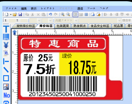
高效设计和打印科学的降价标签